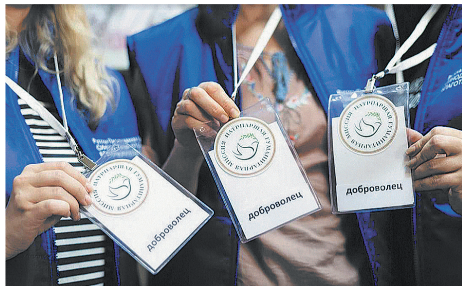
Добровольцы Гуманитарной миссии Русской Православной Церкви

В августе 2023 года решением Священного Синода была создана Патриаршая гуманитарная миссия для общей координации и развития помощи пострадавшим мирным жителям, вынужденным переселенцам, раненым в зоне конфликта. С тех пор тысячи добровольцев в рамках миссии съездили в зону конфликта для ухода за пациентами больниц, госпиталей и социальной помощи пострадавшим. Они помогают в Мариуполе, Донецке, Горловке, Макеевке, Северодонецке, Волновахе, Бердянске и других городах Донбасса, а также в Курске и Белгороде. В одном из госпиталей отстоял свою вахту и наш корреспондент.