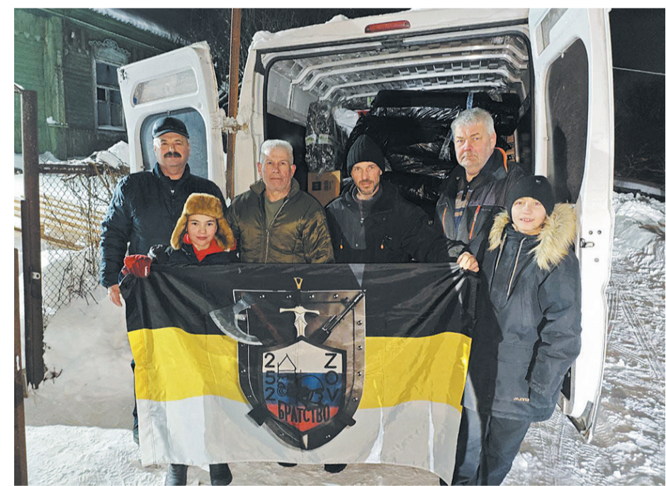
Отправка гуманитарного груза на фронт. 16 января 2026 года