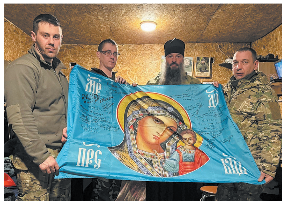
С бойцами одного из воинских подразделений. Белгородское направление, март 2025 года

батальону «Братство» были переданы десятки медикаменты, средства гигиены и одежду. Силами монастыря и радеющих прихожан отправлены транспортные средства, генераторы, стройматериалы и даже мобильная баня. Это самое малое, что мы можем сделать здесь для ребят. Кропотливая работа волонтеров не останавливается даже за пределами мастерских. К общему делу причастны волонтеры