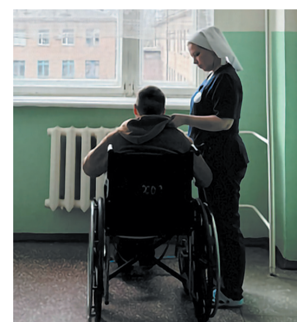
Добровольцы в военном госпитале

Он не хотел этих пятен на щеках и этих слёз. Он вытирает их кулаком левой руки