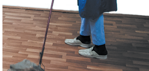
Уборщица в военном госпитале

Чувствую, как под подо мной разверзается, и я готова от неосторожного слова провалиться сквозь землю. На секунду лишуюсь дара речи, пока не приходит на выручку великая русская литература. Спокойно отвечаю: