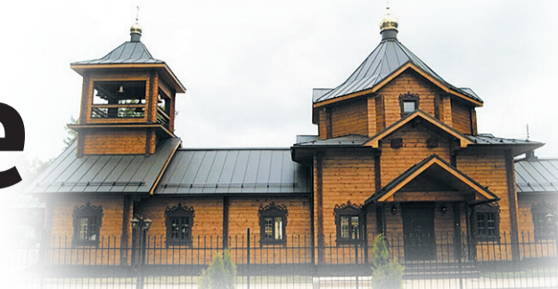
Храм великомученика Георгия Победоносца военного городка Чехов-3

в какой-нибудь монастырь — на Соловки, в Дивеево. Однажды поздним вечером, почти ночью, добрался до Псково-Печерского монастыря. Постучался, монах меня пустил, и я попросил принять меня трудником во славу Божию. И вот именно тогда я ощутил в себе это чувство, которое до сих пор пытаюсь в себе восстановить — чёткое понимание всего, что ты делаешь, максимальная собранность, трезвение ума, уверенность в том, что задача тебе по силам. Каждая мысль предельно ясна, каждое действие — как будто ты не один, а тебя прямо за руку Господь ведёт. Не передаваемо. Тогда ещё был жив отец Иоанн Крестьянкин, мне посчастливилось с ним общаться. Какое-то время даже стал думать о монашестве. Конечно, я сильно поменялся тогда. Друзья-курсанты меня уже перестали узнавать, мне стало неинтересно всё, что мы жили прежде, сейчас об этом даже вспоминать не хочется. Может быть, я стал даже слишком ортодоксальным, но я остро чувствовал ту благодать, которую дал мне Господь, и боялся её расплескать.