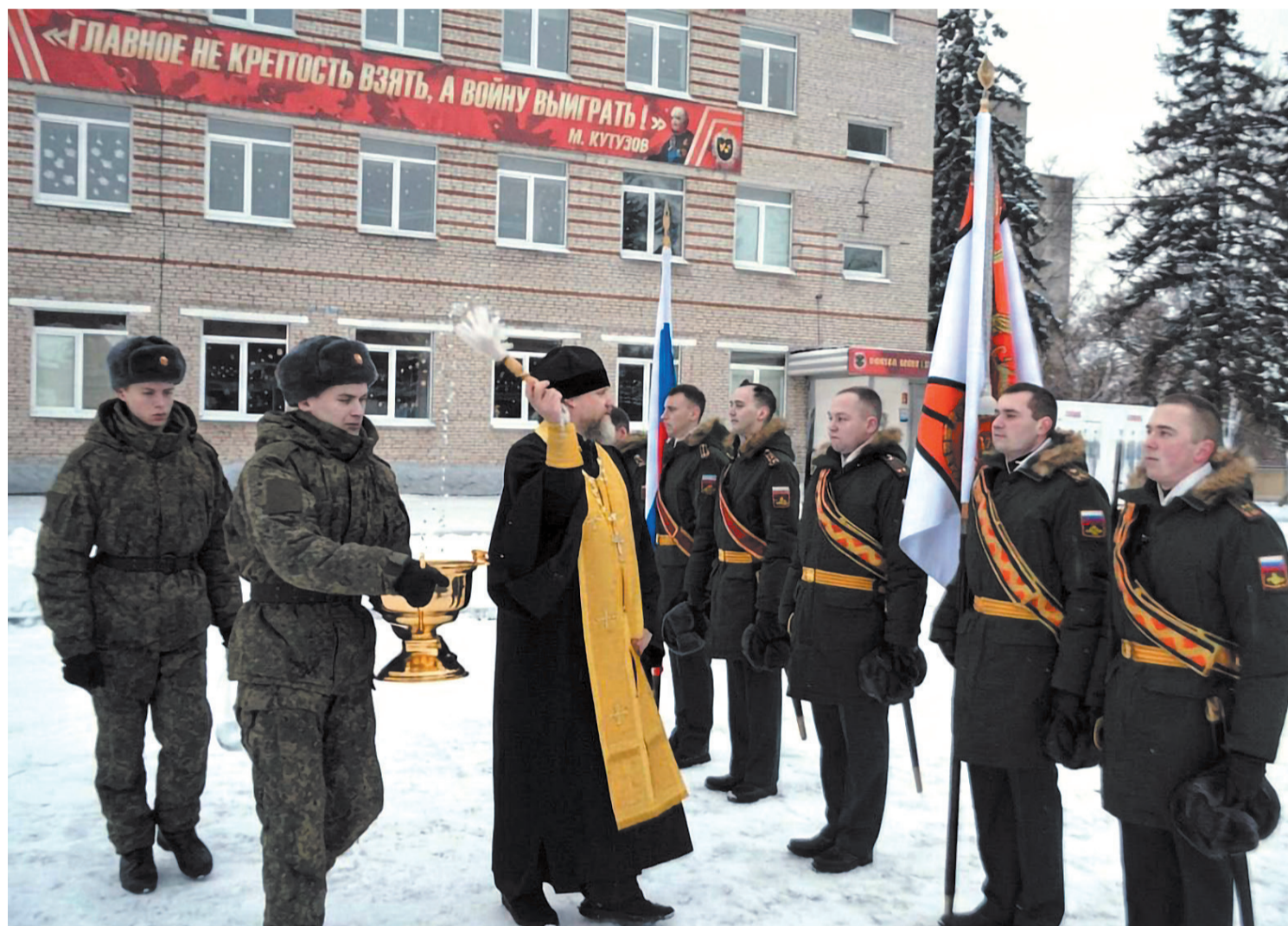
День принесения присяги в воинской части №30663. 27 декабря 2025 года

В этот раз они сошлись в одной временной точке — день начала Великого поста и День защитника Отечества.