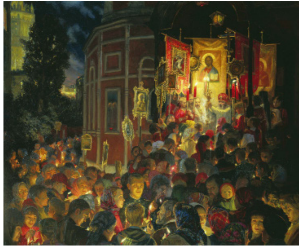
Владимир Маковский. Молебен на Пасху. 1887-1888 годы. Картина находится в Серпуховском художественно-историческом музее

В молитве, в этом трепете души, в непонятной, но такой живой радости, в таинственном, но опять-таки, таком несомненном присутствии Его в храме во время богослужения, в таинствах; всё время растёт этот живой опыт, это знание, эта очевидность: Христос тут, исполнились Его слова -