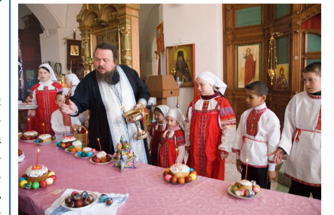
В Бывалино готовятся к Пасхе