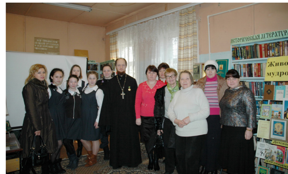
В Скурыгино дружат с книгой