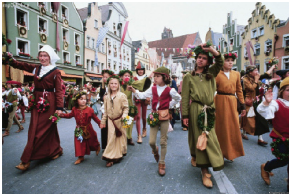
Сразу после Пасхи в испанском городе Севилья открываются весенние ярмарки

Традиции праздника объединяют людей разных континентов