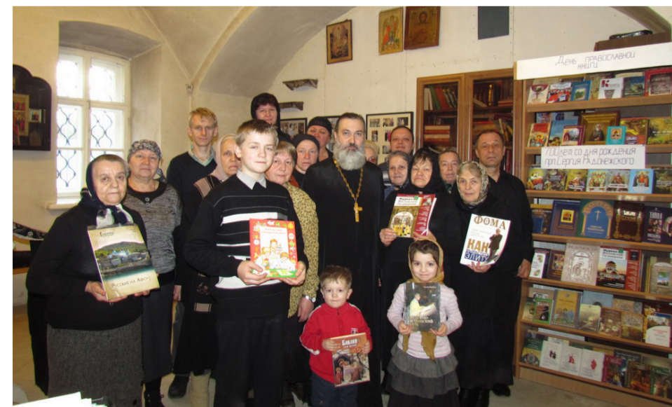
В Троицком собрались читатели всех возрастов

Начало паломническому маршруту было положено в Анно-Зачатьевском храме, где читатели библиотеки поклонились древней иконе XVI века «Зачатие Пресвятой Богородицы», которая пребывала в музее-усадьбе Гончаровых-Ланских-Васильчиковых близ Зачатьевского храма. Этот образ до 1962 года находился в иконостасе Зачатьевского храма города Чехова, а после его закрытия был помещён в Музей древнерусского искусства им.