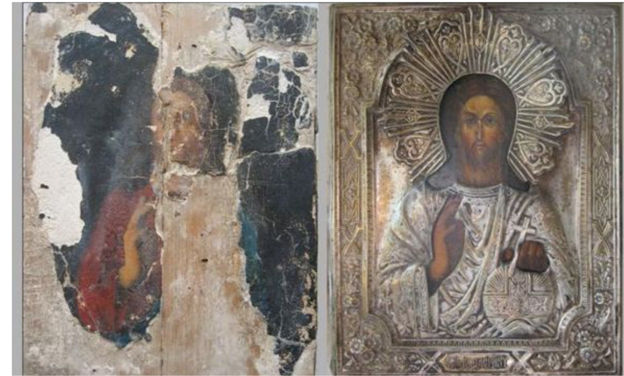
Икона до и после реставрации

Встречи с реставраторами полезны хотя бы для того, чтобы уяснить для себя, действительно ли благоговейно мы относимся к своим домашним иконам. И что хуже - оставлять образа под слоем пыли или натирать их с усердием до блеска, как паркетный пол? Чтобы в этом разобраться, воспользуемся правилами хранения икон, разработанными специалистами кафедры реставрации Православного Свято-Тихоновского гуманитарного университета.