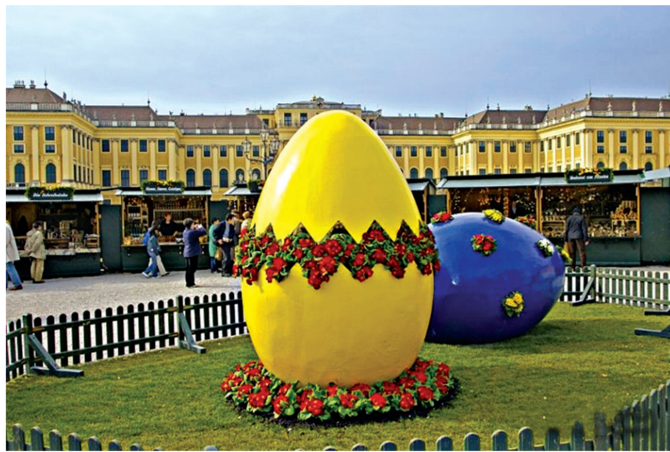
В столице Австрии Вене проходит знаменитый музыкальный фестиваль «Звуки Пасхи»

Светлое Воскресение Христово - самый чудесный Праздник для христиан всего мира. И во всём мире его отмечают. Суть праздника, конечно же, везде остаётся одинаковой, но в некоторых странах есть и свои устоявшиеся обычаи и традиции. Ребята, предлагаем вам вместе с нами отправиться в небольшое путешествие по странам мира. Может, какую-либо из традиций мы возьмём с собой в качестве сувенира?