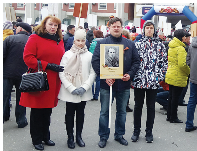
Наша семья — участник акции «Бессмертный полк», 2017 год