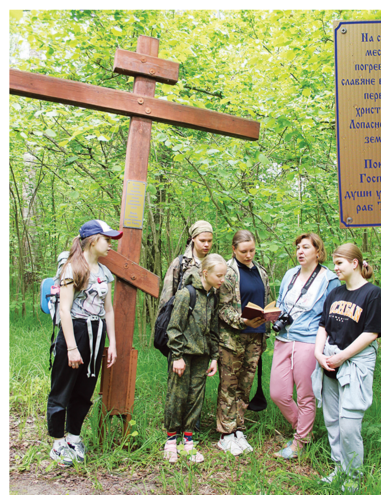
Панихида у поклонного креста 11 июня 2022 года

и воинственными вятичами. Те же в свою очередь ещё более столетия, до начала XII века, упорно отстаивали свою независимость.