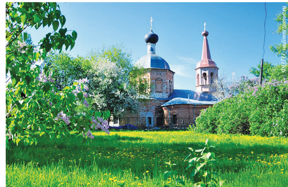
Троицкий храм постройки 1713 года и часть усадебного парка. 2011 год