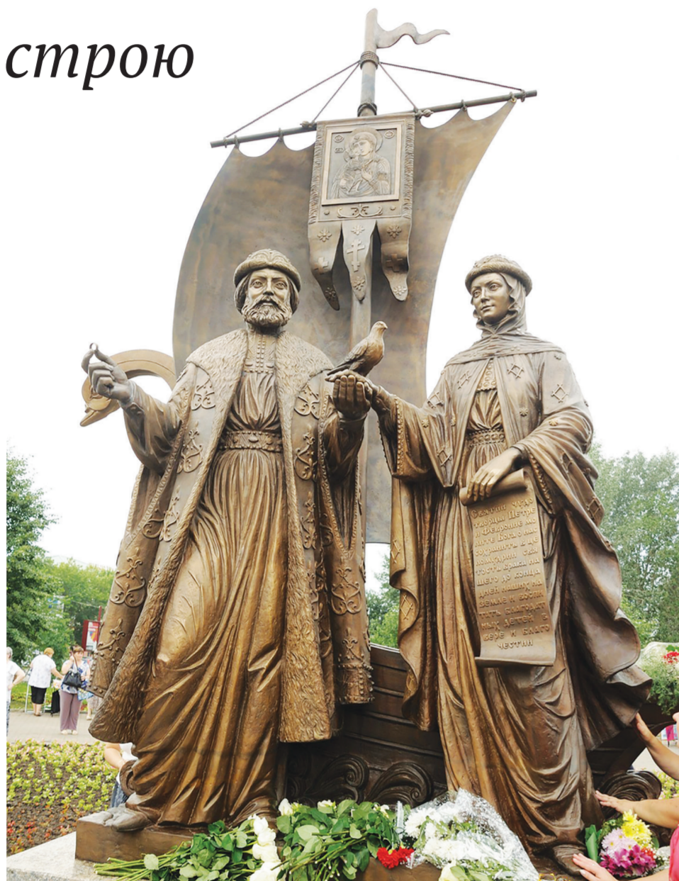
Памятник святым благоверным князю Петру и княгине Февронии Муромским в Екатеринбургe. Установлен 5 июля 2012 года

Перед смертью по благочестивому обычаю супруги приняли монашеский постриг с именами Давид и Ефросиния. Святые Пётр и Феврония скончались в один день. Они завещали положить их в один гроб, который давно для себя приготовили. И по сей день мощи муромских чудотворцев покоятся в общей раке.