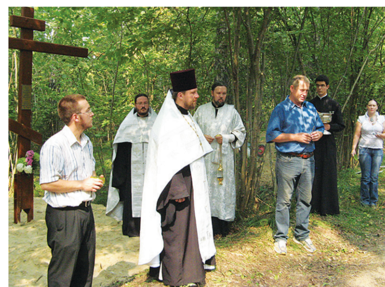
Установка и освящение поклонного креста 14 августа 2010 года

В X веке вятичи платили дань Хазарскому каганату. В 965 году киевский князь Святослав, разгромив Хазарский каганат, пошёл на вятичей, покорил их и обложил данью. Однако эта победа была непрочной. Сыну князя Святослава Владимиру (будущему равноапостольному князю Киевской Руси) пришлось ещё дважды воевать с непокорными