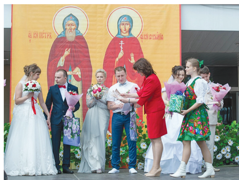
Праздник Семьи, любви и верности в Чехове. 7 июля 2017 года

По-прежнему часто мы встречаемся со случаями, когда поводом к свадьбе становится беременность невесты. Также регулярно заключаются браки между людьми преклонного возраста, когда они начинают задумываться о вопросах насле-