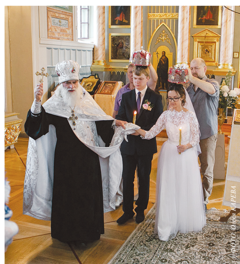
Тайство венчания в Спасском храме села Прохорово.

Наверное, не будет преувеличением назвать настоящий успешный брак подвигом. Именно поэтому Церковь и прославляет тех, кто этот подвиг совершил, — например, святых Петра и Февронию Муромских.