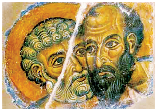
Апостолы Пётр и Павел. Фрагмент фрески монастыря Ватопед. Конец XII в. Афон, Греция

Это единственный пост, продолжительность которого различается