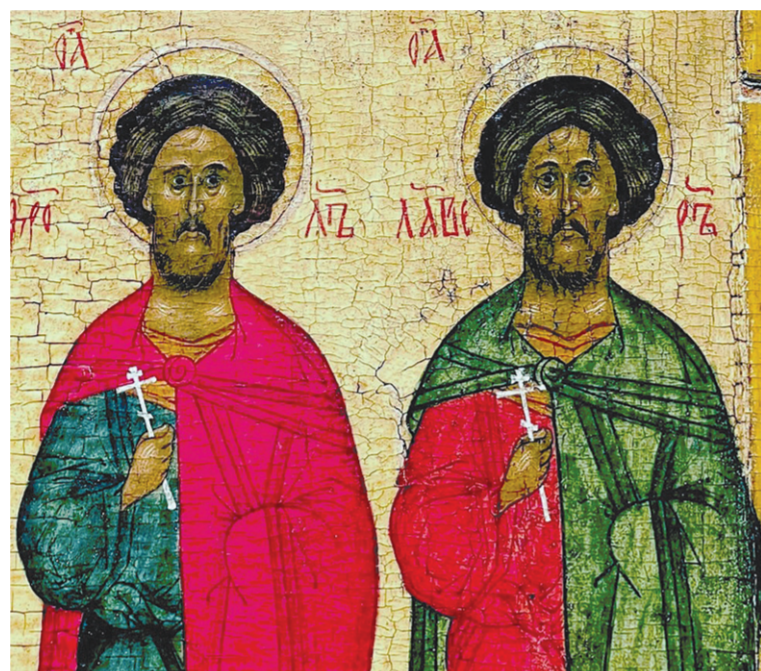
Святые мученики Флор и Лавр. Фрагмент иконы. Новгород, первая половина XVI века

Вест о случившемся донеслась до наместника. Всех последователей Иисуса схватили и, обойдя