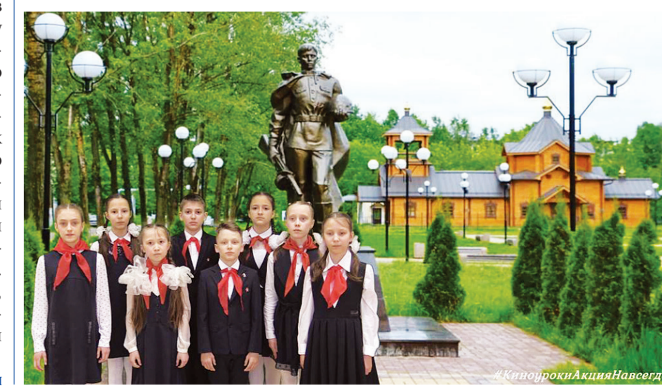
Киноуроки Акция Навсегда

полк», а в деревне Хлевино традиционно прошёл крестный ход к могиле неизвестного лётчика.