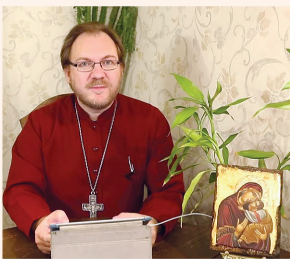
Протоиерей Константин Пархоменко