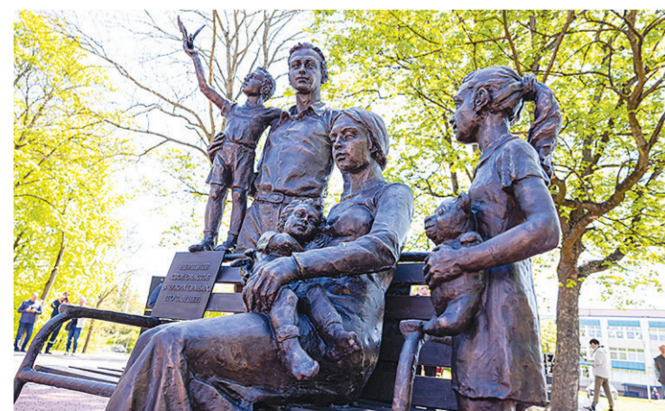
Памятник «Счастливая семья» в Калининграде. Май 2023 года

Не удивительно, что в последнее время в нашей стране стали появляться скульптуры, подчёркивающие важность и радость семейного союза мужчины и женщины, присутствие детей в этом союзе именно как одну из граней нашей национальной идеи. Скульптурные композиции под общим названием «Счастливая семья» сегодня украшают скверы и улицы в Кирове, Орле, Астрахани, Стерлитамаке, Казани, Самаре и других городах Российской Федерации. 11 мая 2023 года в Калининграде также была