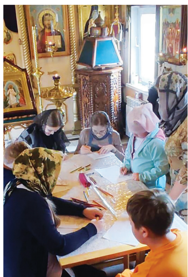
На занятии в воскресной школе

И не стоит забывать о самом главном — о ребёнке. Не следует возмещать за него, подавляя его волю, так как у него есть свобода выбора, данная ему Всевышним. И здесь преем-