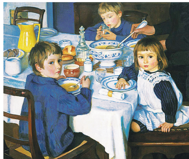
Зинаида Серебрякова «За завтраком». 1914 год. На картине — последние счастливые годы дружной творческой семьи. После революции имя Серебряковых будет уничтожено, муж художницы умрёт от тифа, оставив Зинаиду в 35 лет вдовой с четырьмя детьми и престарелой матерью. В 1924 году Зинаида Серебрякова получила крупный заказ в Париже. Уехала, но вернуться уже не смогла. Таню, изображённую на картине, она увидит лишь через 36 лет, а сына Женю — уже никогда...

Детский пост — тема особая. Как подходить к решению этой непростой задачи?