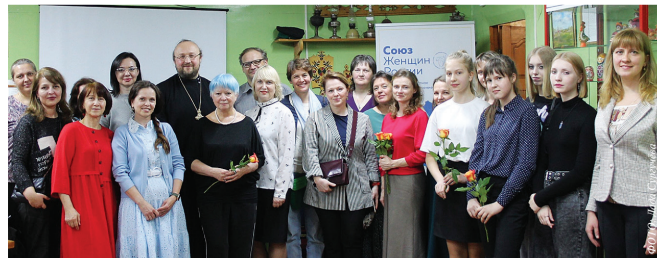
Участники праздника в честь святых жён-мироносиц, 28 апреля 2023 года

В преддверии праздника святых жён-мироносиц в Клубе православных журналистов «Стриж» состоялась очередная встреча. Её участниками стали женщины разных возрастов и профессий.