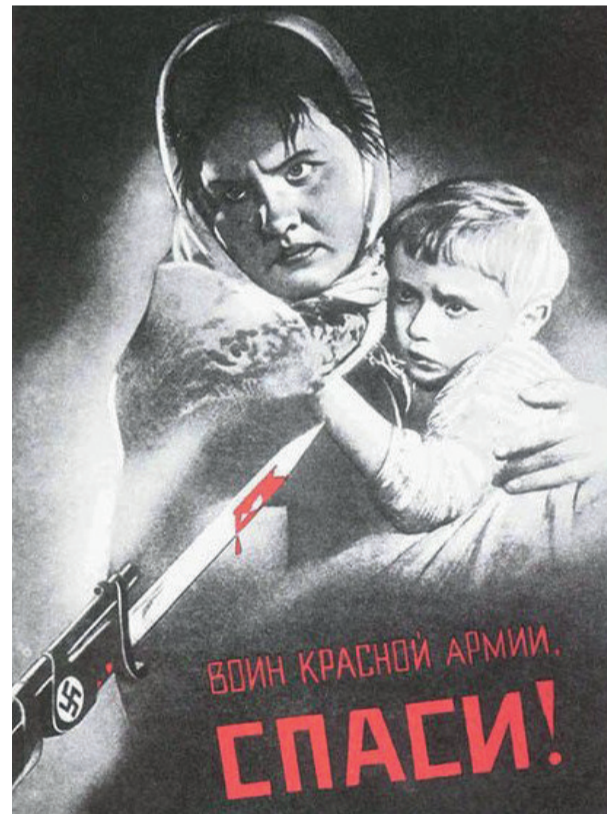
Виктор Корецкий «Воин Красной Армии, спаси!» Плакат, 1942 год

Так и жили мы до 43 года. С началом наступления Красной Армии маму и остальных женщин немцы угнали рыть окопы, а нас, де-