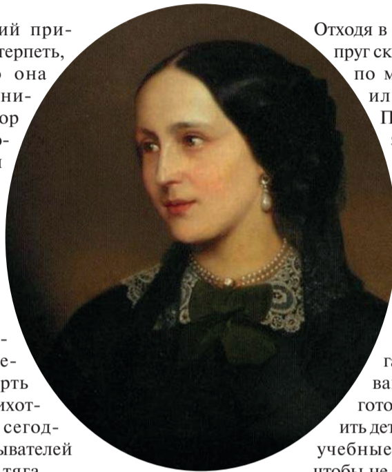
Карл Лаш. Портрет Натальи Николаевны Пушкиной-Ланской (Гончаровой). Частное собрание, 1856 год