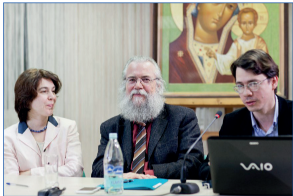
Доктор философии, доктор богословия Жан-Клод Ларше выступает перед студентами и преподавателями Православного Свято-Тихоновского гуманитарного университета. 27 апреля 2012 года

работы видных православных богословов нашего времени. Одна из частей книги содержит выдержки из тру-