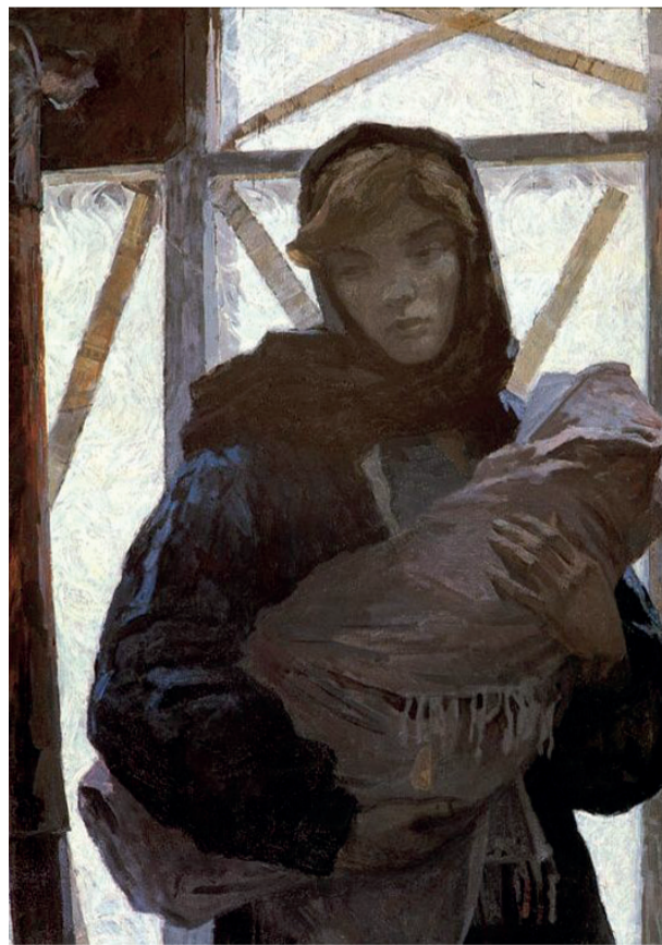
Алексей Михайлов «Тревога». 1965 год

...Ты не можешь ни спать, ни есть. Телефон не выпускаешь из рук не потому, что боишься пропустить