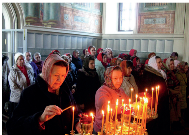
Подпись под фото

Пречистая некоторое время жила в Иерусалиме в доме апостола Иоанна Богослова. После ухода апостолов на проповедь Ей тоже достался жребий миссионерства. Местом Её апостольства стал Афон, куда Она попала после шторма, по пути в гости к епископу Лазарю, который жил на Кипре. Некоторое время Богородица жила в Эфесе. Умерла Она в Иерусалиме, похоронена там же, в Гефсиманском саду. Однако тела в Её гробнице нет — предание гласит, что Сын на третий день после кончины