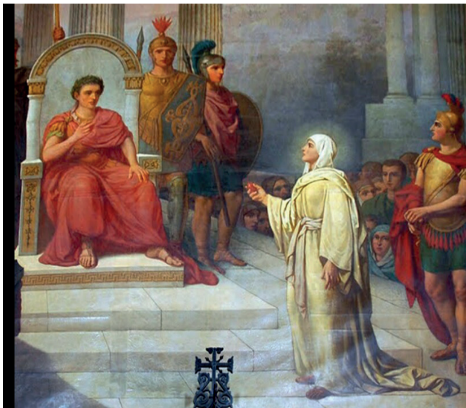
Василий Верещагин «Мария Магдалина перед Тиберием». Храм св. Марии Магдалины в Гефсимании, Иерусалим

В Евангелии они названы не все — перечислив несколько имён, евангелисты добавляют: «и другие». К сожалению, даже по названному нельзя до конца понять, о каком конкретно человеке идёт речь. Как о пришедших ко гробу Спасителя у евангелистов говорится о Марии Магдалине, Марии Клеоповой, Саломии и Иоанне. Сусанну, Марфу и Марию церковное Предание также относит к жёнам мироносицам. Сведений о них немного, и они подчас противоречивые. Но известно вот что: