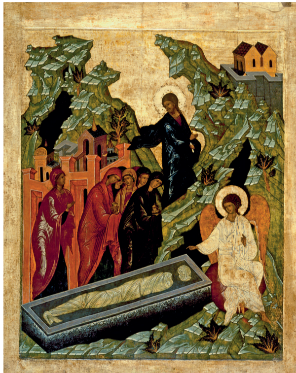
Святые жёны мироносицы у Гроба Господня. Вторая половина XVI века. Москва, Третьяковская галерея

В отличие от упомянутого «8 Марта», значение и смысл Недели Жён Мироносиц никогда не менялись. В этот день во всех храмах говорится об особой роли женщин в жизни Церкви, в мировой истории, воспеваются женские добродетели, ну и конечно, представляется широкая возможность поздравить женщин и чем-то их порадовать! Однако празднование дня Жён Мироносиц не сводится к дифференцированию людей по половому признаку, задача праздника — прославить тот идеал красоты души, то