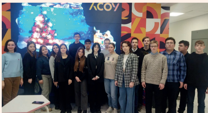
Участники Областной олимпиады по Духовному краеведению Подмосковья из Чехова. 31 января 2024 года

Региональный этап Областной олимпиады по Духовному краеведению Подмосковья состоялся 31 января в Москве, в Духовно-просветительском