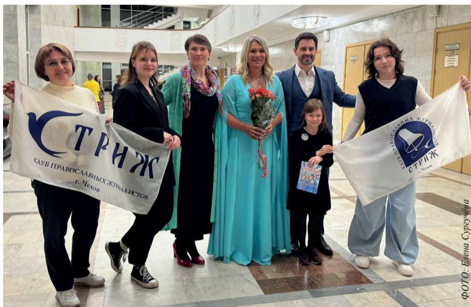
После концерта Антона и Виктории Макаарских. ДК «Октябрь», г. Подольск. 14 апреля 2024 года

Интерес к этому творческому семейному дуэту возник у чеховцев ещё с 2019 года, когда артисты выступили на областном Дне православной молодёжи в городе Одинцово. Уже тогда поразило то, что это не просто популярные исполнители, профессионалы своего дела с великолепными вокальными данными, но ещё и настоящие православные миссионеры, которые своим искусством доносят до зрителей идеи добра,