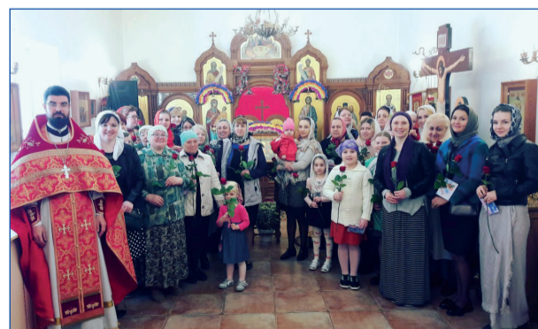
Праздник жён мироносиц в храме Новомучеников Лопасненских. 30 апреля 2017 года

сознания, а от сердца, и Господь сказал: «Где сокровище ваше, там будет и сердце ваше» (Мф. 6:21). К чему или кому сердце стремится, ради того человек и будет отдавать свою жизнь. Вот и получается, что начиная с жён мироносиц и далее в самые тяжёлые периоды в истории Церкви веру сохраняли и несли на своих хрупких плечах женщины, сердце которых пламенело любовью к Богу. Не перечить всем имён тех женщин, которые как мироносицы всецело