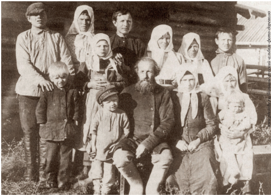
Крестьянская семья XIX века в России

В числе главных целей Года семьи, объявленного Президентом России, значится сохранение традиционных семейных ценностей и улучшение демографической ситуации в стране путём увеличения рождаемости. Думается, в этой связи любопытно будет посмотреть на то, какими были семьи в крестьянских общинах старинных селений, ныне входящих в состав городского округа Чехов.