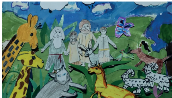
Кадр из мультфильма «Ковчег Ноя и потоп», созданного учащимися воскресной школы Богородицерождественского храма села Васькино, 2024 год

школе, а я теперь отвечаю за творческую составляющую.