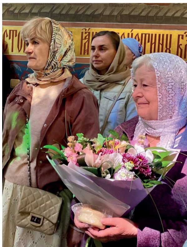
Прихожанки храма Грузинской иконы Пресвятой Богородицы села Якшино. 2023 год

идёт о тех женщинах, которые после распятия и погребения Иисуса Христа на следующий день после пасхальной субботы рано на рассвете пришли на гроб, чтобы помазать тело своего убитого Божественного учителя драгоценным благовонным