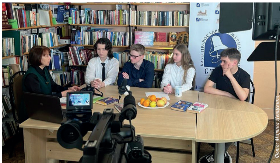
В поисках истины. Юнкоры на одном из своих занятий. 29 марта 2024 года

Для большинства людей существуют некие стереотипы счастья — это материальный достаток, физическое здоровье, взаимная любовь, престижная работа или высокая должность, возможность путешествовать или реализовать свои таланты. Со всем этим можно было бы