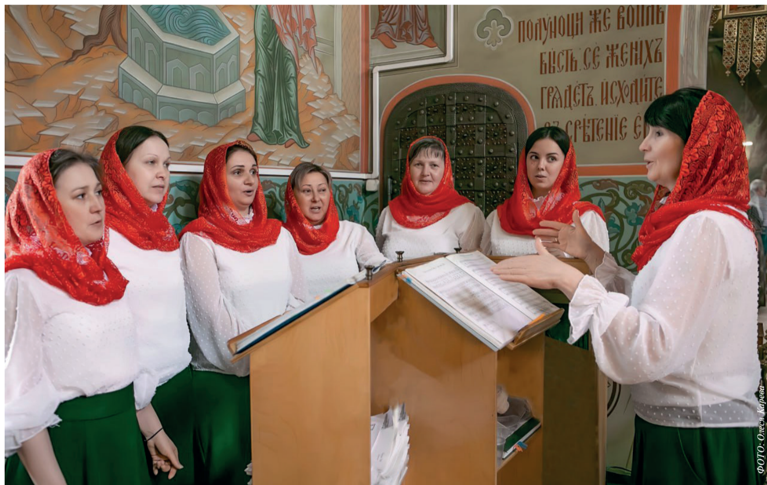
Хор Зачатьевского храма города Чехова. Май 2024 года

Когда-то несколько жён-мироносиц принесли ко Гробу Спасителя драгоценное миро для последнего помазания, явив собой образец самоотверженной любви.