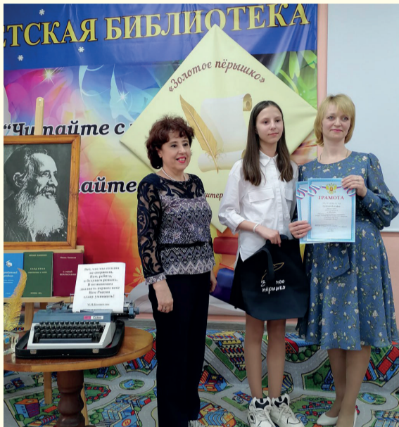
Торжественное награждение победителей конкурса «Золотое пёрышко» в Центральной детской библиотеке. 26 апреля 2024 года

Недавно в Центральной детской библиотеке были названы победители Открытого городского детского литературного конкурса «Золотое пёрышко». В работе жюри приняли участие журналисты газеты «Добрый пастырь».