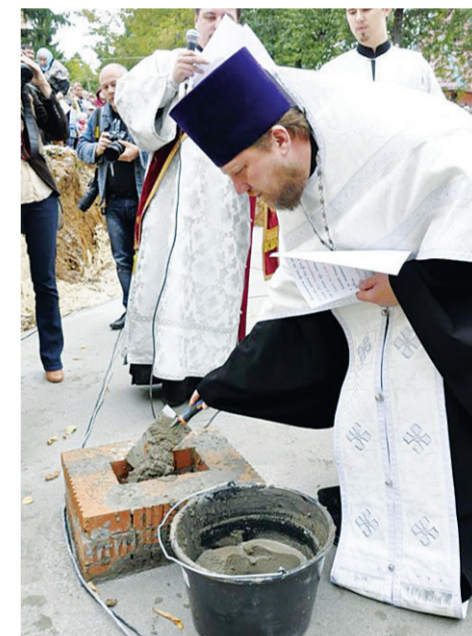
Освящение закладного камня храма святителя Луки Симферопольского в Чехове. 31 августа 2013 г.

До сих пор не переданы Церкви 21 храм и 1 часовня.