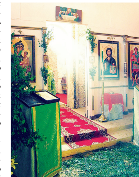
Свет Троицы. Фото на конкурс «Дорога к храму» Анны Терёхиной

Если, к примеру, кому-то достался в дар хороший музыкальный слух, высокий, чистый голос, то посмотрите, сколько доброго и полезного можно сотворить этим инструментом! Можно, например, украсить песней школьный праздник, а можно уба-