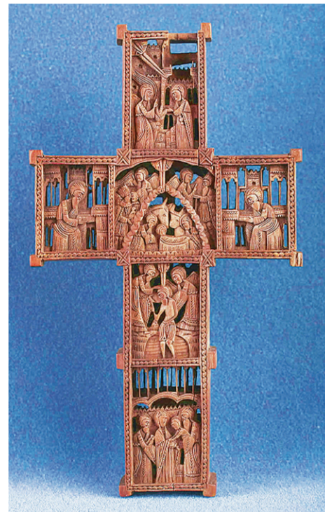
Крест двусторонний, XVIII век, Афон, дерево, высота 8 см.

соревнованиях высокого уровня. Однако известно, что в артистической среде широко распространён обычай прикалывать крестик ко внутренней стороне костюма. Так и театральные образы не нарушаются, и крестик по-прежнему остаётся натальным, то есть проводником помощи Божией. Что же касается пловцов — тут, соглашусь, вариантов нет. Подобно как и в случае, когда человеку предстоит сложная операция. Однако это отступление от внешнего выражения своей веры носит временный характер и ни в коем случае не связано с отречением от Христа.