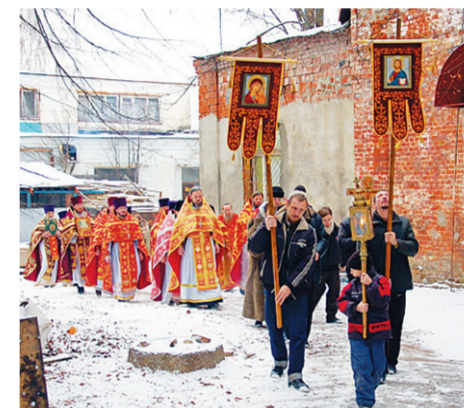
Крестный ход в Преображенском храме посёлка Новый Быт в день памяти священномученика Владимира (Красновского). 25 ноября 2011 г.

рый заверил Патриарха, что в ближайшие годы в области не останется ни одного невосстановленного храма. — Столь твёрдая позиция митрополита Ювеналия не может не вызывать уважения.