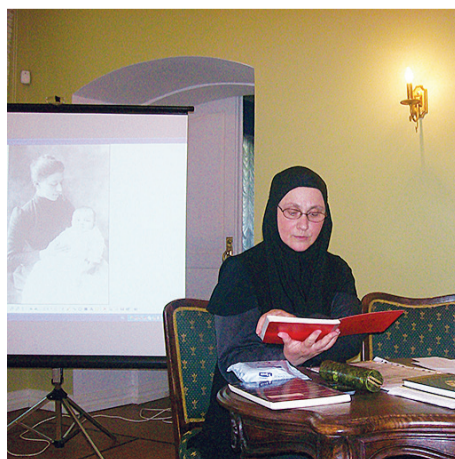
Мать Силуана в Гончаровском доме