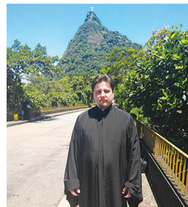
У подножия горы Корковаду в Рио-де-Жанейро со статуей Иисуса Христа на вершине.