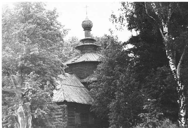
Храм Рождества Христова, 70 г. XX века.

Удивительно, как похожи друг на друга документы, повествующие о закрытии далёких друг от друга храмов. Слово все события происходили по одному спущенному сверху и написанному под копиру сценарию. Я сознательно старалась сохранить канцелярский стиль документов, которые якобы были написаны крестьянами. На деле же они и слов-то таких не знали.