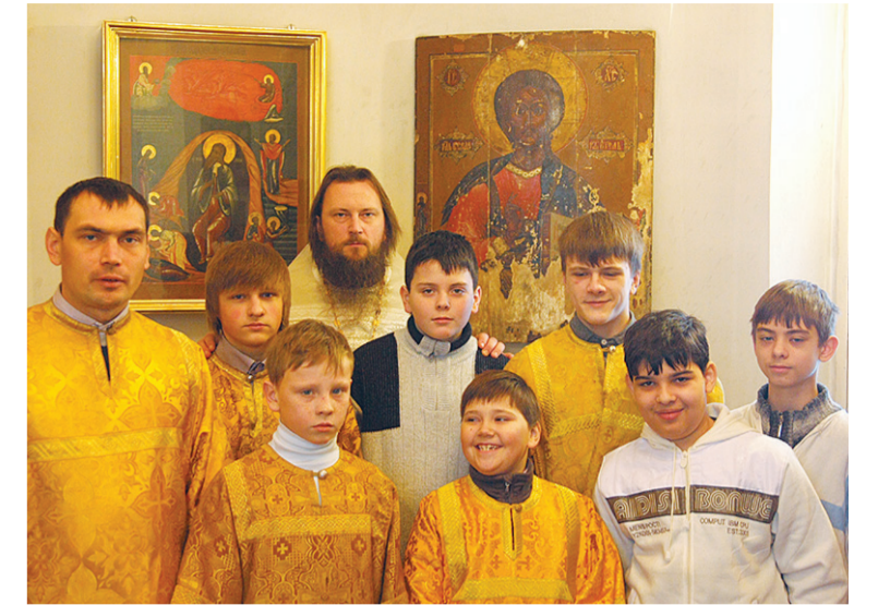
Занятия в школе пономарей.

Мы познаем Закон Божий, изучаем Ветхий и Новый Завет, рисуем, делаем поделки. Я думаю, что эти знания и умения очень пригодятся нам в жизни, помогут правильно поступить в трудной ситуации, избежать многих ошибок, опасностей и сохранить мир в душе. При изучении Священного Писания мне особенно интересна тема сотворения мира. Ведь это так важно знать и понимать - кто мы и зачем мы... Мне очень нравятся праздники у нас в школе и на приходе, особенно Рождество Христово. В нашем храме это праздник престольный. К нему заранее и тщательно готовятся. В убранстве церкви появляется что-то новое, свежее, наря-