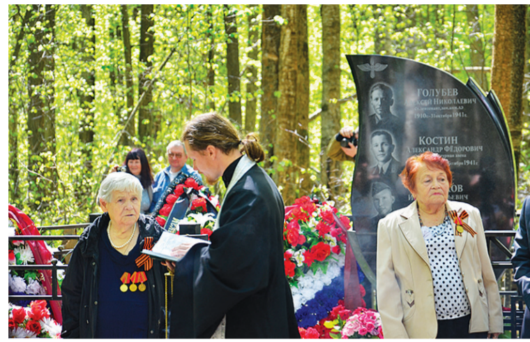
Теперь за погибших героев можно молиться поимённо. 2014 г.

Более десяти лет приходят школьники из Чернецкого к этому обелиску в лесу на границе Подольского и Чеховского районов. Сначала это было место упокоения неизвестных лётчиков, погибших здесь осенью 1941 года. Теперь – место славы воздушного экипажа, имена всех четверых членов которого ныне известны.