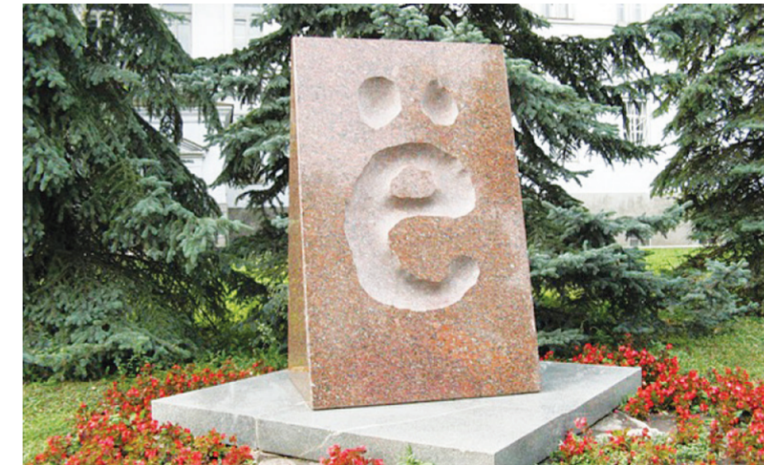
Памятник букве «ё» в Ульяновске. Установлен в 2005 г.

Ребята, сегодня в нашей рубрике мы поговорим об удивительной букве русского алфавита - той, день рождения которой доподлинно известен и которой даже поставлен памятник! Вы, наверное, уже догадались, что речь пойдёт о букве «ё».