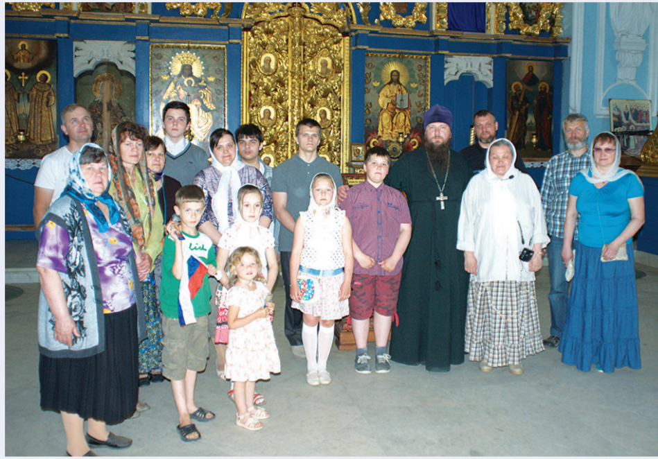
Паломническая поездка в храм села Дубровицы Подольского района