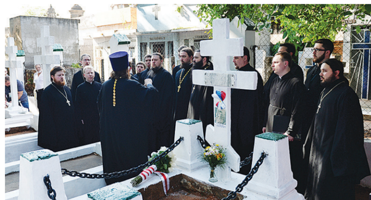
Заупокойное богослужение на Русском участке центрального кладбища Асунсьона.

Отслужив в армии, я поступил в Нижегородскую семинарию, затем по благословению архиепископа перевёлся в Тамбовскую семинарию. После моей хиротонии во диакона я не оставил хорового пения, участвовал в разных хорах. А когда приехал в Подмоскovie, в Чехов, то через