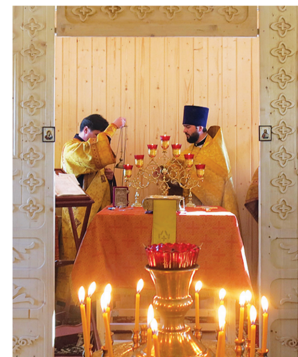
Первая Литургия в храме «Споручница грешных». 13 марта 2016 г.

В кратчайшие сроки удалось разработать архитектурный проект малого храма для проведения богослужений,