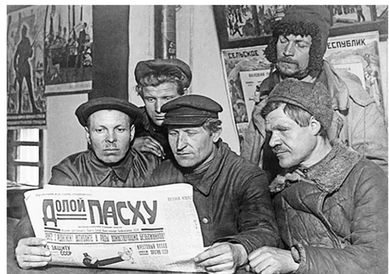
Антирелигиозная пропаганда, 30-е годы XX века. Архивное фото