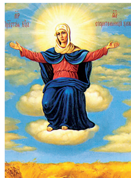
Иконе Божией Матери «Спортельница хлебов» молятся об умножении плодов земных и небесных.

Однако массовая кампания по «лишению прав» стала прологом к более страшным