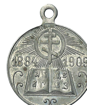
Оборотная сторона медали «В память 25-летия церковно-приходских школ». 1909 год

На практике задача создания училищ при каждом церковном приходе решалась сложно и долго. Например, к 1832 году в Серпуховском уезде имелось лишь два церковно-приходских училища на 54 мальчика и 29