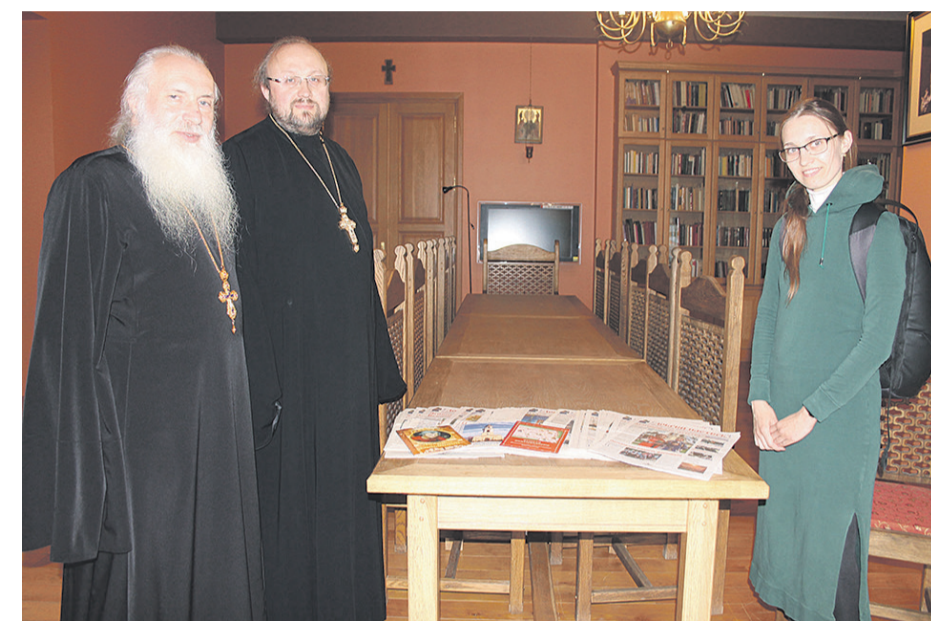
Передача газет «Добрый пастыр» в фонд Синодальной библиотеки. 28 июня 2023 года

Мы узнали, что Синодальная библиотека получила своё название лишь с учреждением в 1721 году Синода, а в момент своего появления, в XVI веке, она называлась Патриаршей. Это было уникальное хранилище церковных и светских, в том числе и самых древних, книг. Библиотека всегда располагалась в Москве, за исключением 1812 года, когда книги временно были вывезены в Вологду, что и позволило поистине бесценным изданиям уцелеть во время страшного московского пожара.