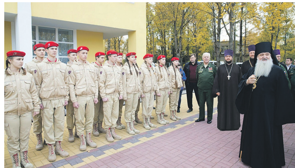
День Великого освящения храма в честь великомученика Георгия Победоносца в военном городке Чехов-3. 3 октября 2018 года

многом этому способствовала Великая Отечественная война, но и после неё тенденция к матриархату продолжилась. В итоге для очень многих брак перестал быть Таинством, Всевышнему, по Завету Которого и заключались союзы мужчин и женщин.