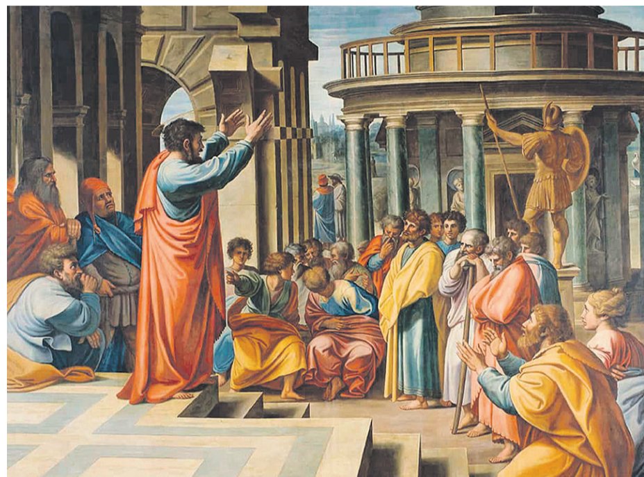
Апостол Павел в Афинах. Рафаэль Санти. 1515 год. Рисунок для гобелена. Бумага, темпера. Музей королевы Виктории и Альберта, Лондон

Православие всегда настаивало на непрерывности Божественного Откровения и опыта жизни в Боге, а также на непрекращающейся передаче этого опыта от одного поколения людей к другому. Другой, альтернативный вариант христианства в XVI веке предложил протестантизм. Выдвинув лозунг «sola Scriptura» («только Писание»), он фактически отверг постулат непрерывности Откровения и необходимости передачи опыта духовной жизни. По версии лидеров Реформации, Откровение уже случилось когда-то, оно полностью зафиксировано в Священном Писании, а задача верующего человека заключается в том, чтобы в этом закрытом Откровении разглядеть и его принять. Какие-то духовные авторитеты, вроде тех же Лютера или Кальвина, конечно, могут быть, но в целом их авторитет безусловен, что, по сути, и привело к возникновению тысяч и тысяч других протестантских движений, наподобие баптистов или адвентистов, где каждая из деноминаций имеет свою отличную от других доктрину. Получается, что доктрина «только Писание» без принятия Предания в широком смысле этого слова неизбежно приводит к тому, что можно называть «только моё понимание Писания».