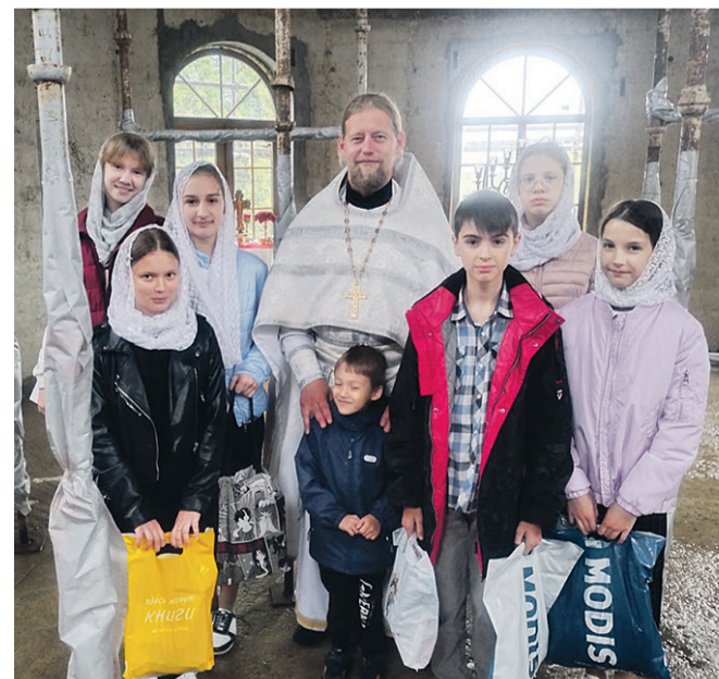
Вручение подарков детям прихода храма святителя Луки