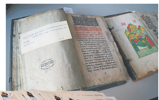
Теперь в Синодальной библиотеке рядом с древними книгами будут храниться номера нашей газеты