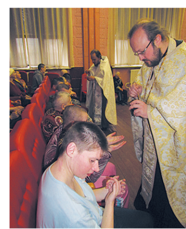
Соборование в Антроповском психоневрологическом интернате.

— Вопрос о духовном окормлении инвалидов, как правило, решается индивидуально, в зависимости от степени поражения болезнью. Имеется практика так называемой «молчаливой исповеди», когда сам священник отвечает на вопросы исповеди за больного. В каких-то случаях исповедовать и причащать больного невозможно — но тогда его можно помазать, пособоровать. Беспорно то, что в духовной практике заключается много терапевтического, и обращение к ней всегда благотворно влияет на больного и на его родственников.