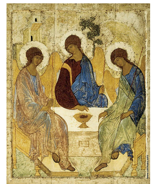
Андрей Рублёв «Троица». 1411 год или 1425-27 гг. Дерево, темпера. Из собрания Государственной Третьяковской галереи.

«Из истории иконографии Святой Троицы». Ж. «Московские епархиальные ведомости», №№5-6, 2006 г. Полностью материал читайте на сайте: