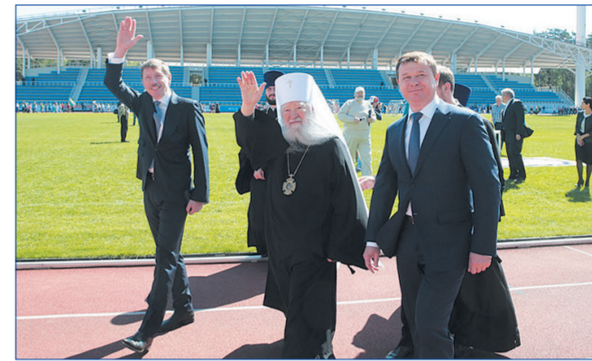
Открытие XV Фестиваля физической и духовной культуры в Жуковском.