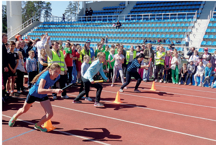
Нелёгкая борьба на фестивале духовной и физической культуры.

А может ли культура духовная сочетаться со спортом? Способен ли профессиональный спортсмен оставаться христианином? Интересно, что Святейший патриарх Кирилл, напутствуя наших олимпийцев, сравнил их образ