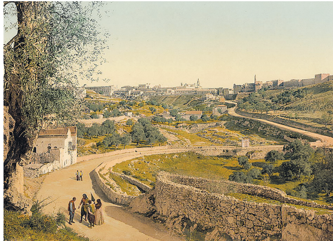
Иерусалим, путь к станции. Палестина. 1890 год. Архивное фото.

Я не останавливаюсь, следовательно, существую!