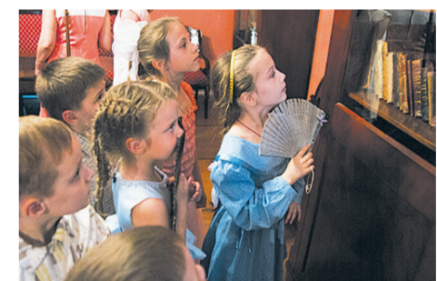
На празднике в усадьбе «Лопасня-Зачатьевское»

24 мая, в день празднования славянской письменности и культуры,