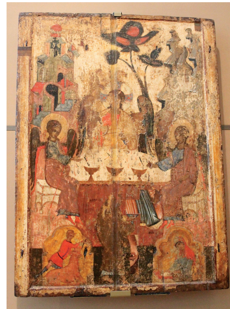
Троица. 2-я пол. XIV в. Ростов. Из собрания Государственной Третьяковской галереи.

Мы учились тогда в начальной школе, но уже считали себя взрослыми, поэтому