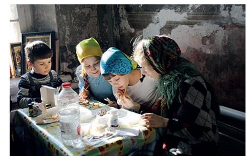
Коллектив учащихся воскресной школы Скорбященского храма села Шарипово «В воскресной школе».

С удовольствием побывал на фотовыставке — и не только потому, что здесь были и мои работы, за кото-