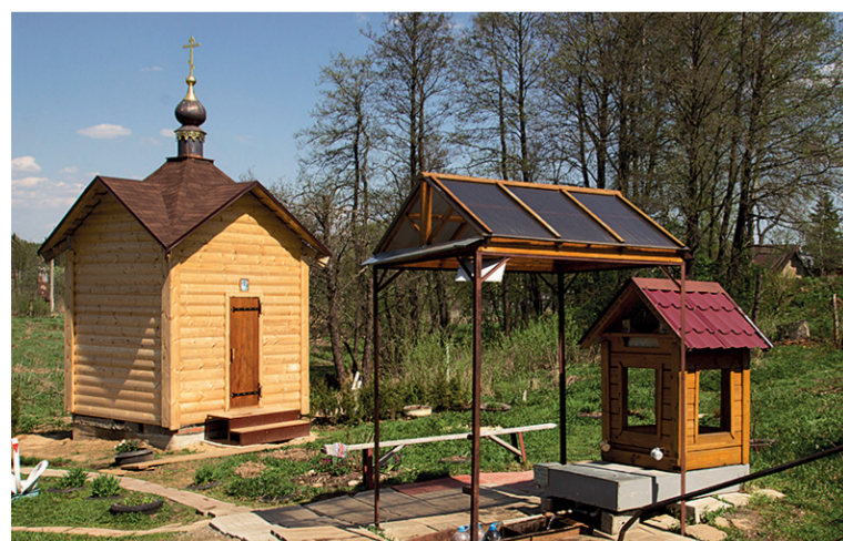
Часовня в Ваулово

Встану рано, помолюсь, Да из родника напьюсь. Положу поклон тебе До земли, родная Русь!