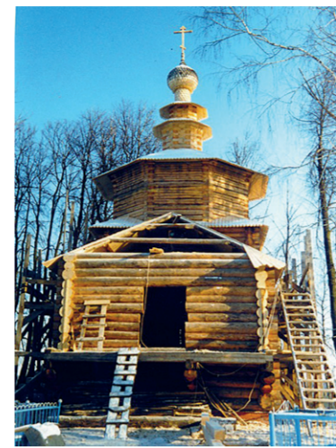
Восстановление храма после пожара

По молитвам нашлись и помощники, и деньги, и материалы, и рабочие. Не в Москве, не в области, а именно в Чеховском районе нашлись силы, поднявшие из руин мелховскую церковь. Ктитору мелховской церкви