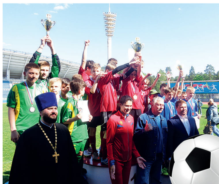
Победа досталась сильнейшим.

дят под эгидой Церкви, нет победителей и побеждённых. «Все мы выигрываем!» — говорит митрополит Ювеналий. — Участие воспитанников воскресных школ в спортивных состязаниях формирует их волю, укрепляет дружбу, закладывает фундамент здоровья и, я бы сказал, счастья».