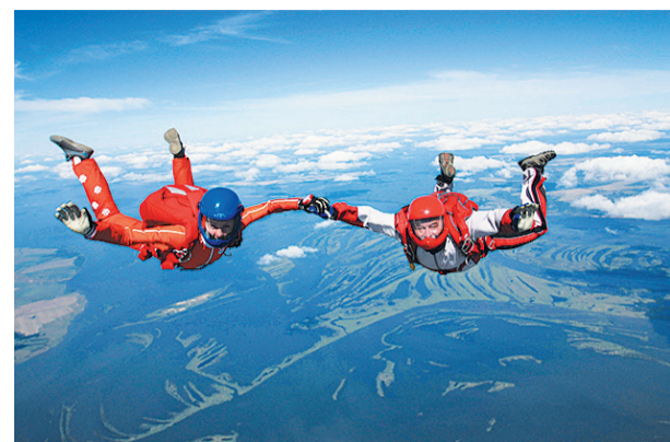
Прыжок с парашютом в паре с дочерью

Был такой памятный для меня случай. Во время одной из экспедиций долгое пребывание на МКС мне