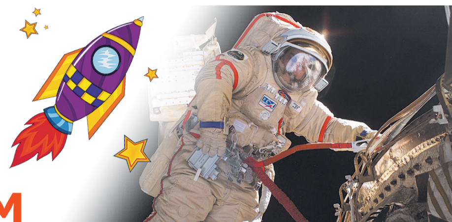
Лётчик-космонавт Михаил Тюрин во время выхода в открытый космос

Встретиться с космонавтом мечтает каждый. И такая встреча состоялась у юнкоров Клуба православных журналистов «Стриж» на приходе Георгиевского храма в Ивантеевке — они побывали в гостях у Героя Российской Федерации, лётчика-космонавта РФ, звоняра Михаила Тюриня.