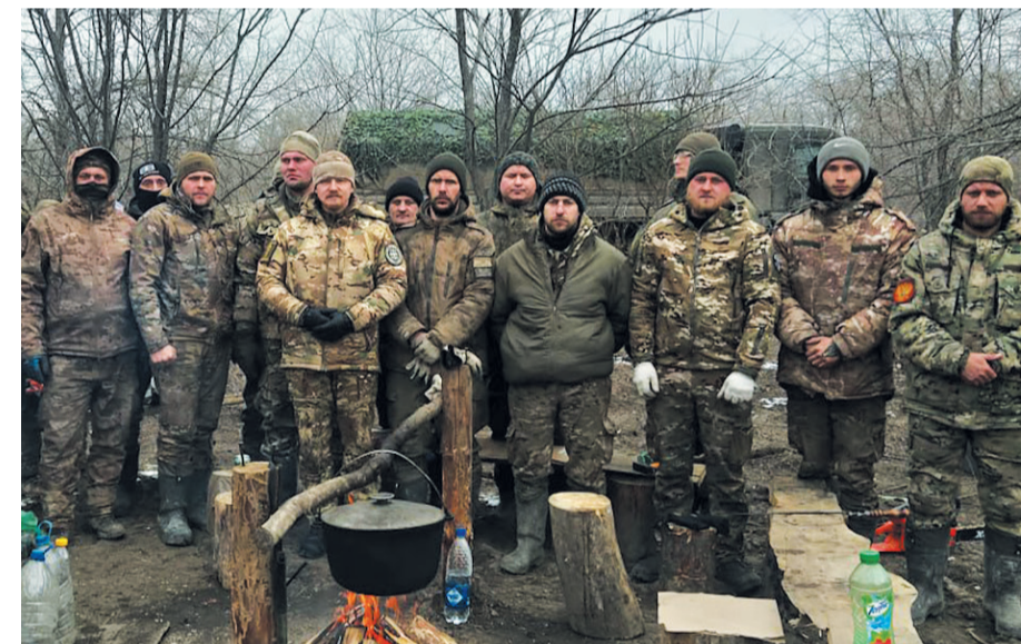
На привале с бойцами. Февраль 2024 года

Выезд в прифронтовую зону из ППД был намечен на утро. Сборы были недолгими. Минут за сорок до отъезда командир объявил мне о своей готовности и предложил погрузить вещи в его уазик. По прошлым нашим встречам я уже понял, что, если выезд намечен на 9, готовиться надо к 8. И это знание мне не раз помогало. Как ни пытались я сократить массу рюкзака, мне это не удалось. Он упрямо весил 30 кг. Коробка со сладостями для бойцов, собранная на приходе, необходимая для бойцов, собранная на приходе, необходимая для бойцов, собранная на приходе, необходимая для бойцов.