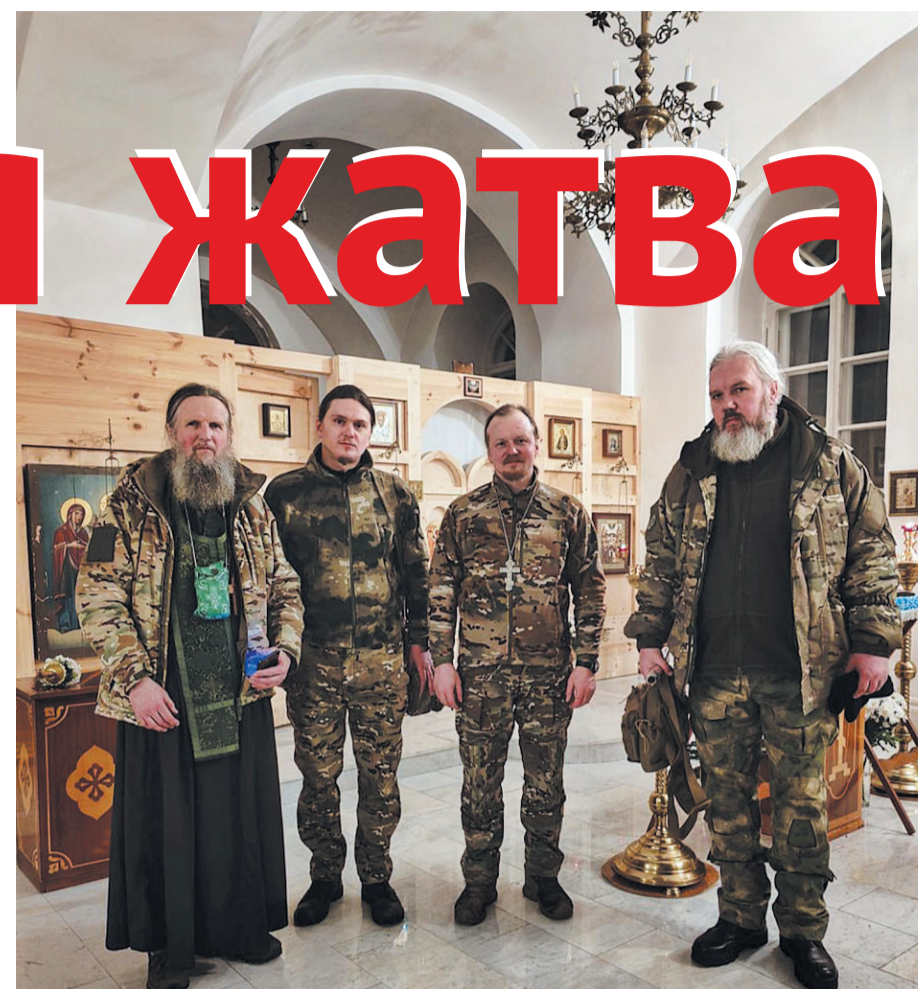
Перед отправкой в прифронтовую зону. Февраль 2024 года