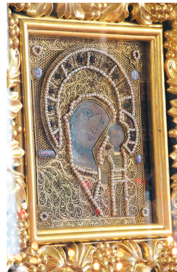
Казанская икона Пресвятой Богородицы в Зачатьевском храме г. Чехова

(Евр. 13:7). В том числе и отцов Седьмого Вселенского собора, их же молитвами да укрепит нас Господь в истинной вере!