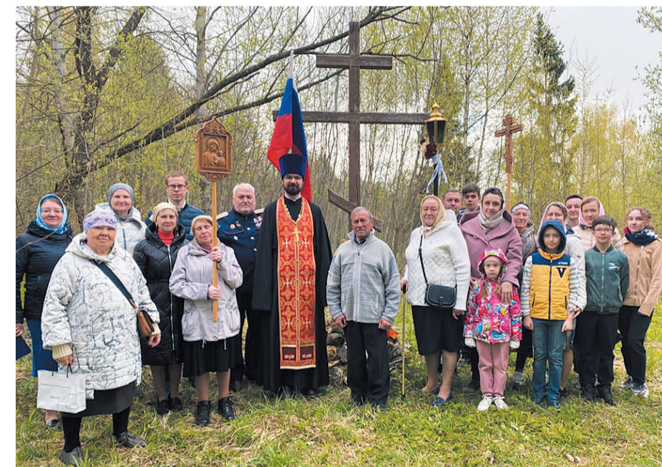
В День Победы к поклонному кресту в Ровках совершается крестный ход

Полностью до нас дошло лишь имя настоятеля храма Преображения Господня на погосте Старый Спас. Все годы войны там служил