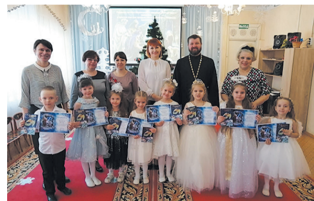
Активные участники и победители Рождественских образовательных чтений