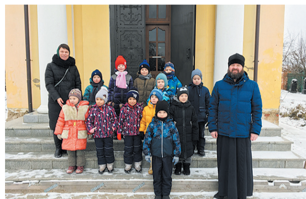
Традиционная экскурсия в храм

Путь к храму у каждого свой. Хорошо, если на этом пути найдутся помощники и наставники. И чем раньше произойдёт такая встреча, тем лучше.