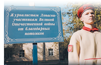
Журналистам Лопасни участникам Великой Отечественной войны от благодарных потомков