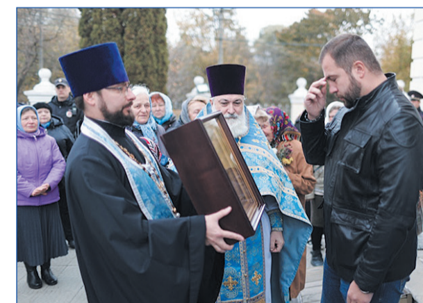
Святыня прибывает в Чехов. 12 октября 2024 года

Сегодня наша страна, исповедующая истинную веру, является оплотом мира и гуманизма для всего человечества. Несмотря на санкции Запада, Россия твёрдо стоит на защите основ Православия, укрепляет свою армию,