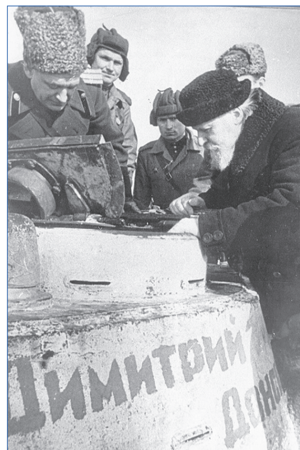
Митрополит Николай (Ярушевич) в день передачи Красной армии танковой колонны «Димитрий Донской». 7 марта 1944 года

Практически нелегально митрополит Сергей начал церковные сборы на оборону страны, на помощь армии, на содержание раненых в госпиталях и помощь сиротам в детских домах. 5 января 1943 года он послал Сталину телеграмму, прося его разрешения на открытие Церковью банковского счёта, и это стало важным шагом на пути к фактической легализации Церкви. Сталин