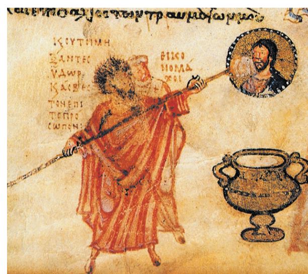
Миниатюра из Художеский псалтири: аллегорическое изображение иконоборчества

собой отпадение человека от Церкви. Храня свою чистоту, Церковь установила мощное ограждение от лжеучений в формате Вселенских Соборов – собраний епископов христианских общин со всей Церкви. Это единственный высший авторитет в Церкви по вопросам вероуче-