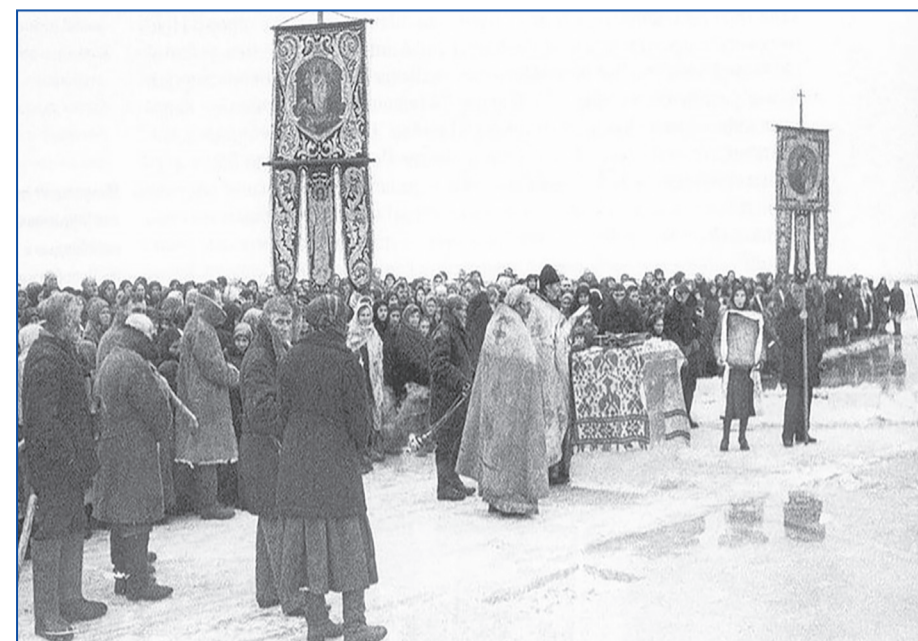
Крестный ход в блокадном Ленинграде с иконой «Казанская». 1942 год

Во все трудные времена на Руси обращались к чудотворным заступницам. Казанская икона Пресвятой Богородицы была полковым образом народного ополчения Минина и Пожарского и в 1611 году была принесена под занятию польско-литовскими интервентами Москву. Перед этой святыней участники русского вой-