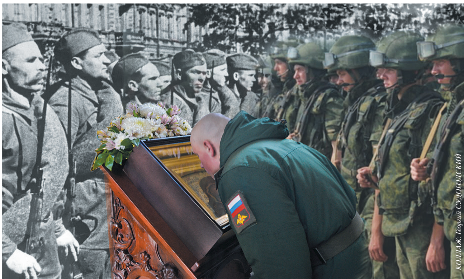
КОЛЛАЖ: Георгий Судогодский

Рождественские чтения: помнить, чтобы действовать