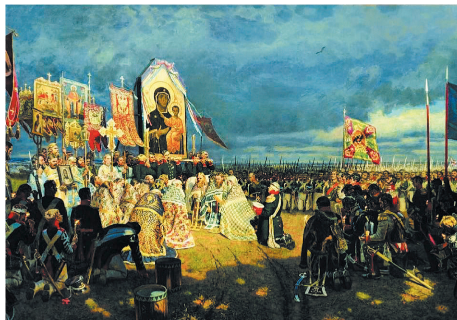
Егор Зайцев «Молебен на Бородинском поле». 2002 год