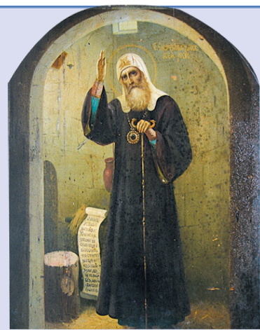
Икона «Патриарх Гермоген» Виктора Васнецова. 1913 год, Государственный исторический музей, г. Москва

Можно не сомневаться: выход Руси из лихолетья Смутного времени в начале XVII века связан не только с именами Минина и Пожарского, но в первую очередь — с именем Патриарха Гермогена, который в такое сложное время взял на себя ответственность за судьбу всей страны. Страстный защитник православной веры, он заплатил жизнью за своё ревностное отношение