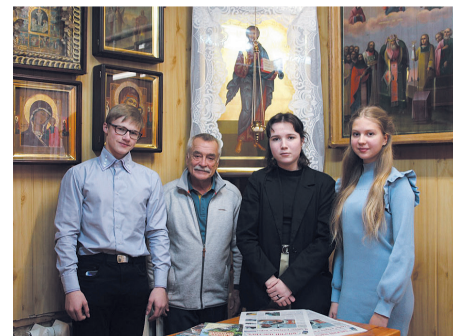
Чеховские юнкоры на встрече с космонавтом Михаилом Тюриним

— Ну конечно! Мне повысили зарплату! Я, когда ушёл из космоса, стал в храме помогать как инженер — тут таких задач хоть отбавляй. Но однажды батюшка благословил меня стать звонарём — и я не смог отслушаться. Потом естественным образом и школа зво-