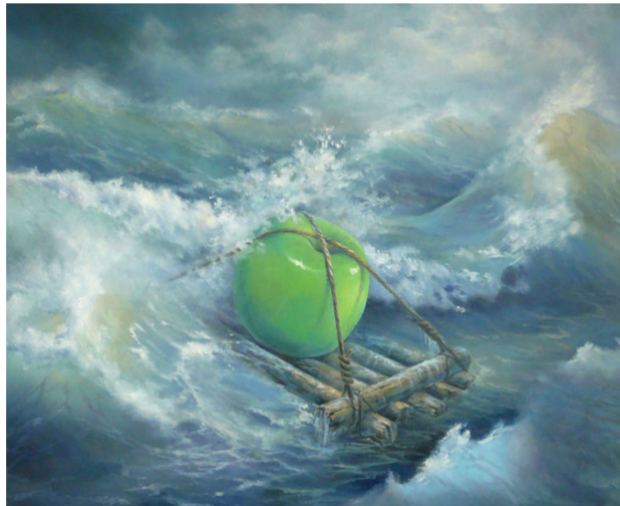
Константин Шаханов. Спасение целомудрия, 2006 г.

Знают ли об этом руководители наших СМИ? Заглядывают ли они хотя бы в толковый словарь? Для них целомудрие — некий атавизм, удобный бухгалтерским счётам. И они, полагая, удивятся, если узнают, что нас много — юношей и девушек, которые почитают целомудрие как христианскую добродетель, которые стремятся