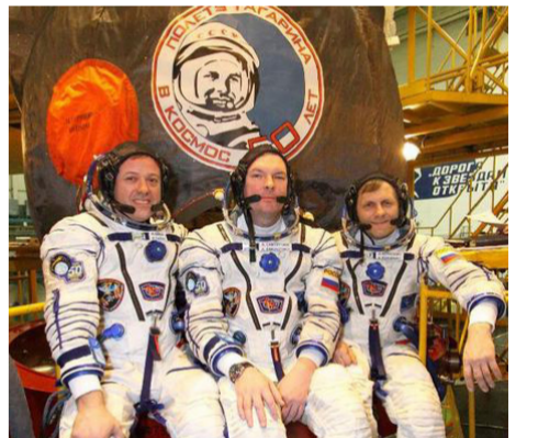
С этим экипажем Казанская икона Божией Матери отправилась на орбиту

держался Ленинград, ведь помощи ему практически не было: то, что подвозили, было каплей в море. И тем не менее город выстоял. Снова подтвердились слова, сказанные святителем Митрофаном (Воронежским) Петру I о том, что город святого апостола Петра избран Самой Богородицею, и пока Казанская Её икона пребывает здесь, пока есть молящиеся, враг не одолеет город. Вот почему ленинградцы так почитают Казанскую икону Божией Матери.