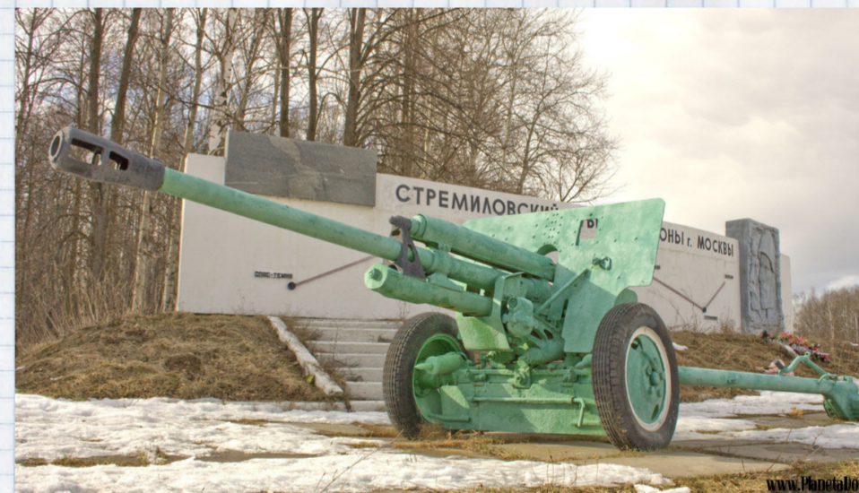
Стремиллово. Здесь по линии обороны проходил крестный ход

В селе Стремиллово одной женщиной во сне явилась сама Матерь Божия, приказала ей взять икону, находящуюся у неё в доме, и идти с ней к передовым частям Красной армии, отслужить перед иконой молебен и крестным ходом пройти по Стремилловскому рубежу.