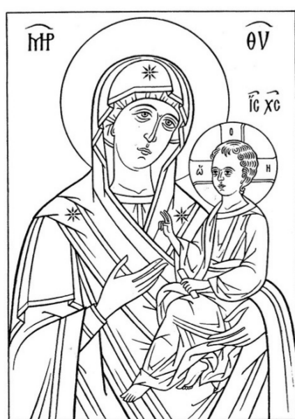
Прорись № 1

Посмотрите внимательно на свою домашнюю икону. Вы знаете, как она называется? Какова её история? К какому иконографическому типу она относится? Расскажите об этом родителям, своим братьям или сёстрам.