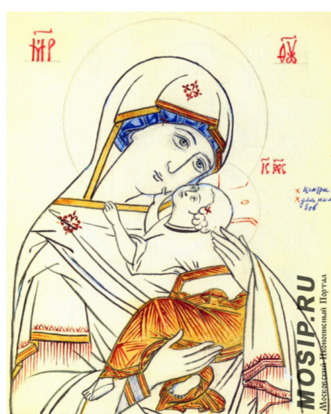
Прорись № 2

Читатели, первыми приславшие свои ответы, получают в подарок книгу «Азбука православия».