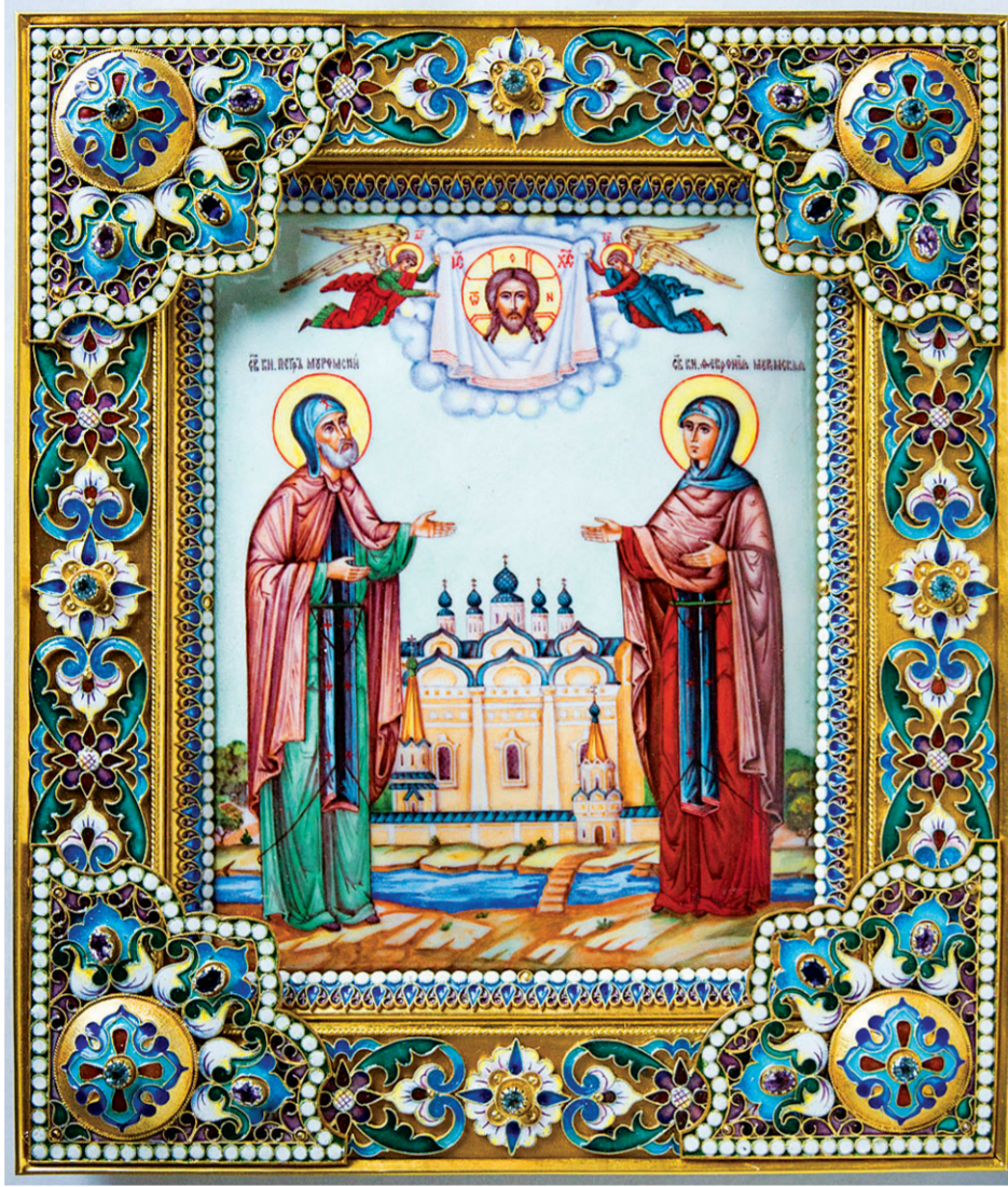
Петр и Феврония Муромские – супруги, святые, ярчайшие личности Святой Руси, своей жизнью отразившие ее духовные ценности и идеалы.

Князя, который сам ходит уже не мог, привезли к дому, и он послал спросить, кто хочет его вылечить. И